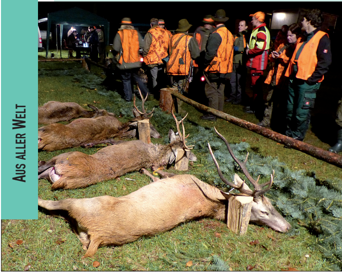
Rothirsche bis Achter waren in der Pauschale inkludiert.