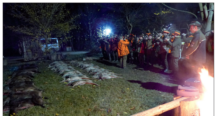
Insgesamt wurden an beiden Tagen über 60 Stück Schalenwild gestreckt, davon war die Hälfte Rehwild.

Ich war als vorletzter Schütze am Anstand; als mein Gruppenleiter wieder an meinem