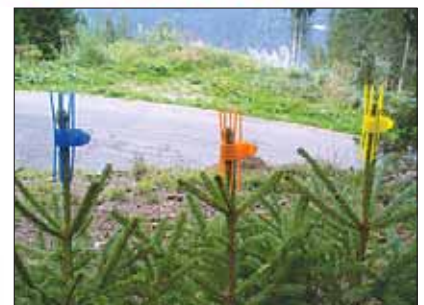
Wir liefern frei Haus von Österreich!