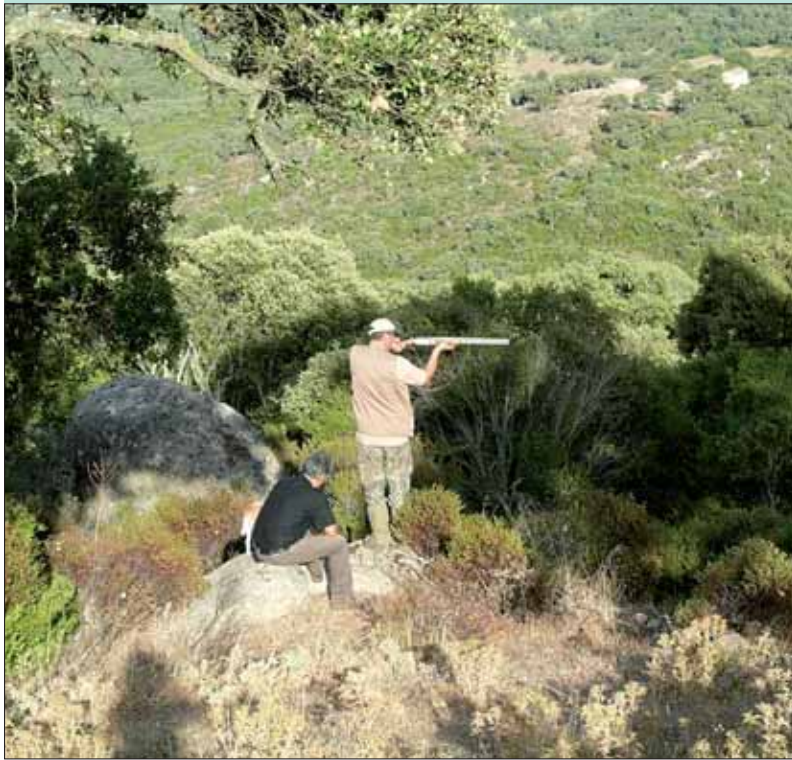
Stand bei den Korkeichen