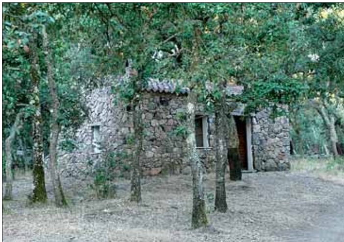
Eine landestypische Unterkunft auf Sardinien

Beim sardischen Steinhuhn überwiegen die Farben creme/gelblich, orange und grau. Der Schnabel ist wie bei allen Rothühnern rötlich. Wie alle Steinhuhnrasen bevorzugen diese Vögel trockene Gebirgsböden. Das Jagdrevier reicht bis circa 1.100 NN. Die Vögel fliegen kraftvoll und wendig, aber nicht sehr weit, dafür bewegen sie sich schnell