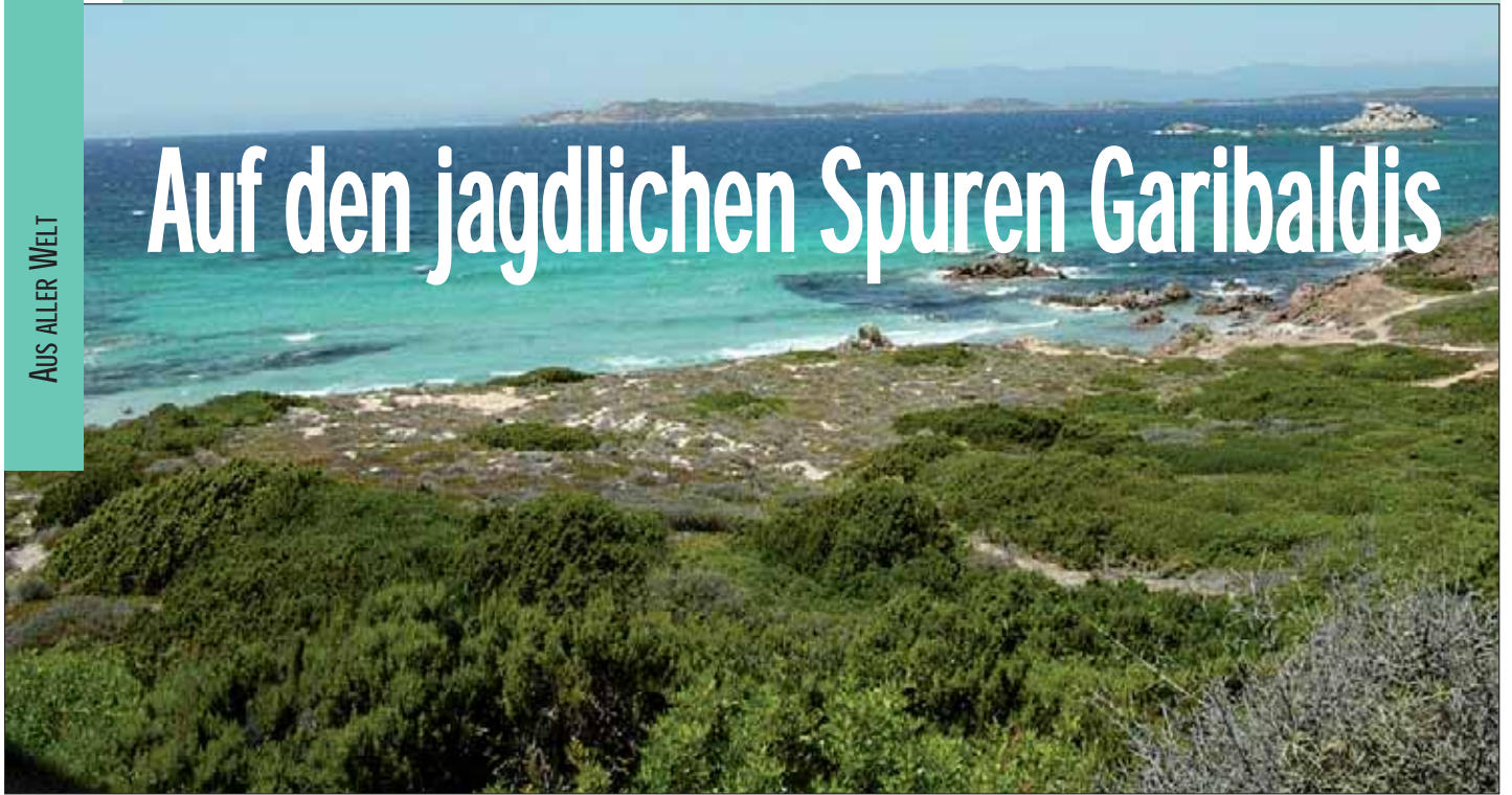
Blick von Sardinien auf Korsika

F rüher war die Gallura, so heißt die sardische Provinz in der wir jagen, sehr dünn besiedelt.