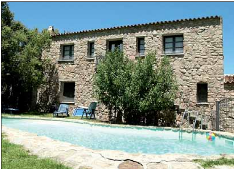
Haupthaus mit Pool

Nach unserem Eintreffen am Abend gab es ein Dinner, wobei der Tisch wie beim Edel-Italiener gedeckt war, die Speisen in mehreren Gängen waren von hervorragender Qualität, lokaler Wein, Wasser und Mirto/Kräuterlikör bis zum Abwinken. ▶ ▶ ▶