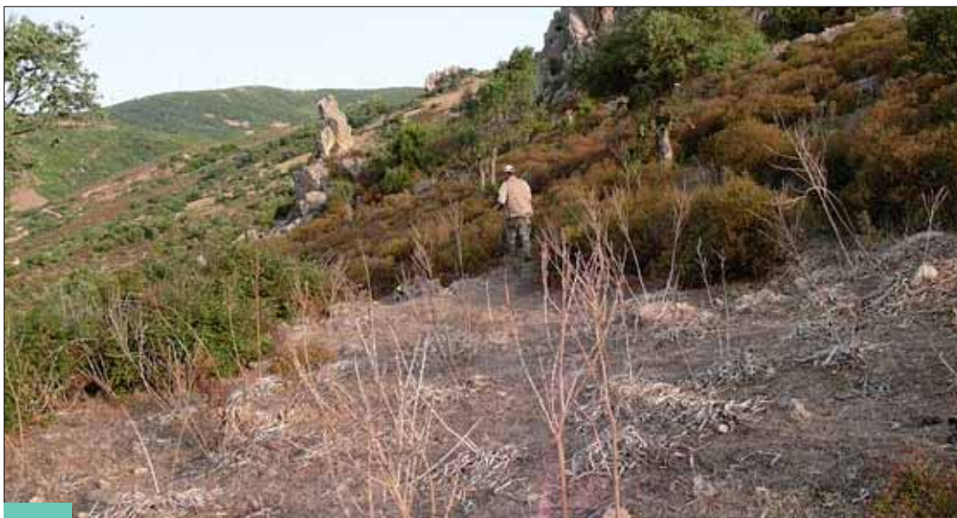
Durch die Macchia

Die bekannteste Küste ist die Costa Smeralda, die in den sechziger Jahren als Erste touristisch erschlossen wurde. Im Binnenland bestimmen Kork-eichenwälder und die Macchia die grandiose Berglandschaft.