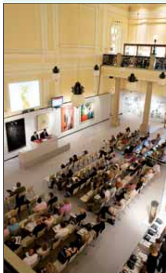
Auktion im Dorotheum

Fein gearbeitete Waffen erzielen Spitzenpreise - Jetzt einliefern