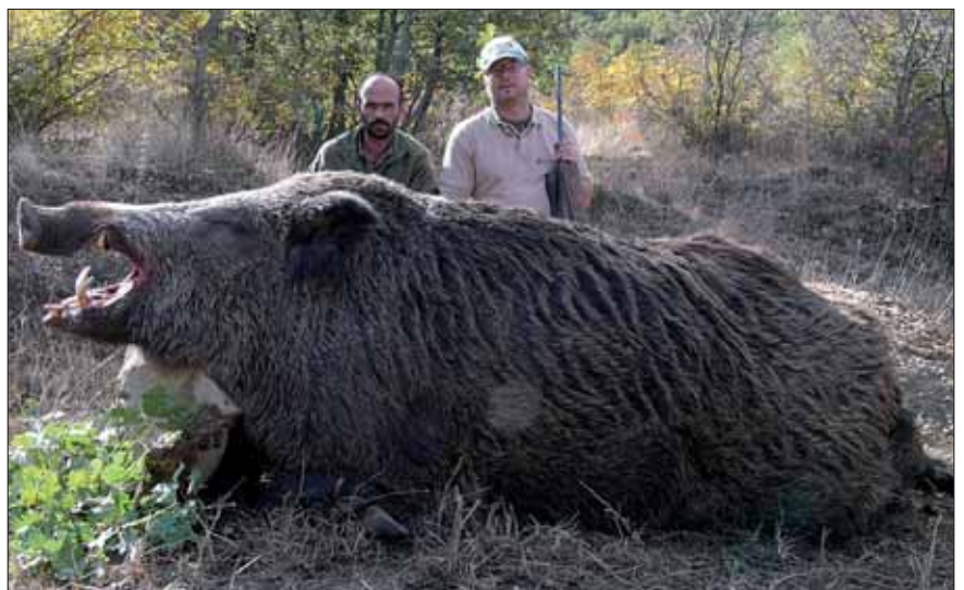
Keiler 24,5 Zentimeter.