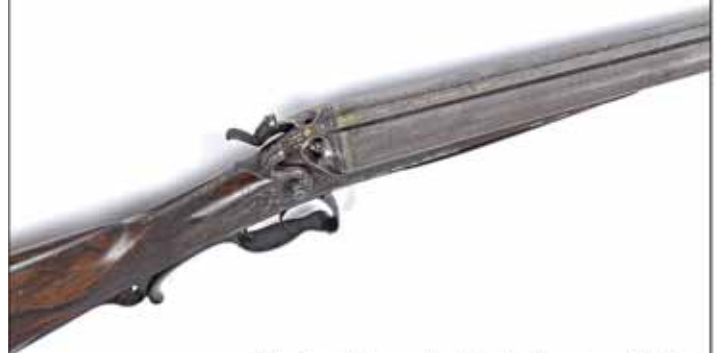
Hahn-Doppelflinte aus dem Besitz des Kronprinzen Rudolph, Auguste Francotte-Lüttich / Johann Springer's Erben - Wien, Ruffpreis € 7.000