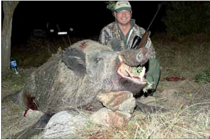
Keiler 27,5 Zentimeter.

Mein Jagdführer deutete an, dass es sich um einen Keiler handele und ich mich schnell fertig machen sollte, um den Selbigen zu strecken. Hektisch wechselte ich das Fernglas mit der Repetierbüchse und legte