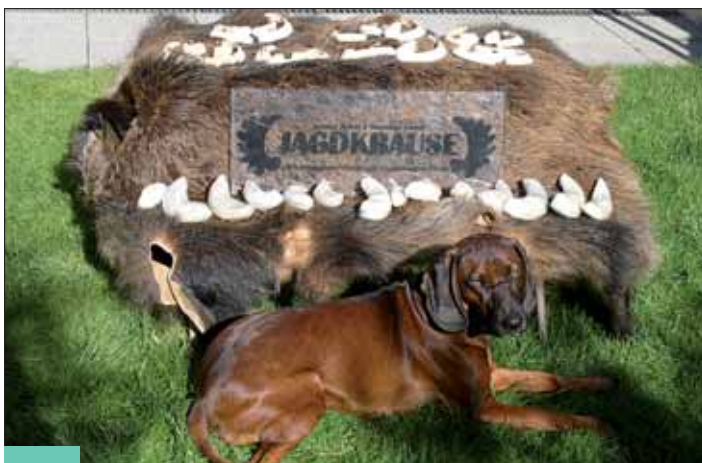
Keilerwaffen der Jagdkrause-Kunden von Corum.