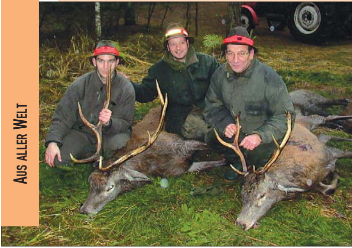
König und Vizekönig mit ihrem Agenten.

Nach dem Abblasen entlade ich meine Waffe. Danach gehe ich mit den Treibern zu dem zuletzt erlegten Keiler im Schilf. Kaum, dass wir den Keiler an Land gezogen haben, taucht keine 50 Gänge neben uns unverhofft noch ein Keiler auf und wechselt hochflüchtig über die Wiese in die nächste Weidendickung.