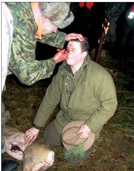
Flämischer Jungjäger mit seinem ersten Stück Wild.