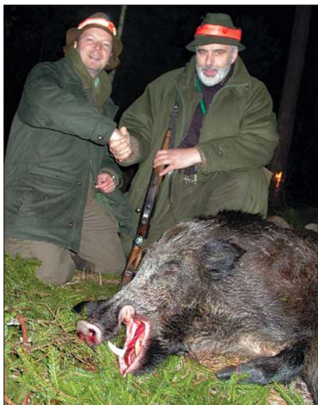
Bisher stärkster Keiler mit 23 cm.

Keine 90 Gänge entfernt ziehen, wie an einer Perlenschnur aufgezogen, Sauen aus der Weidendickung vor mir auf die freie Fläche, die nächstgelegene Dickung zu. Zwei, drei, vier, fünf zähle ich. Nun ist