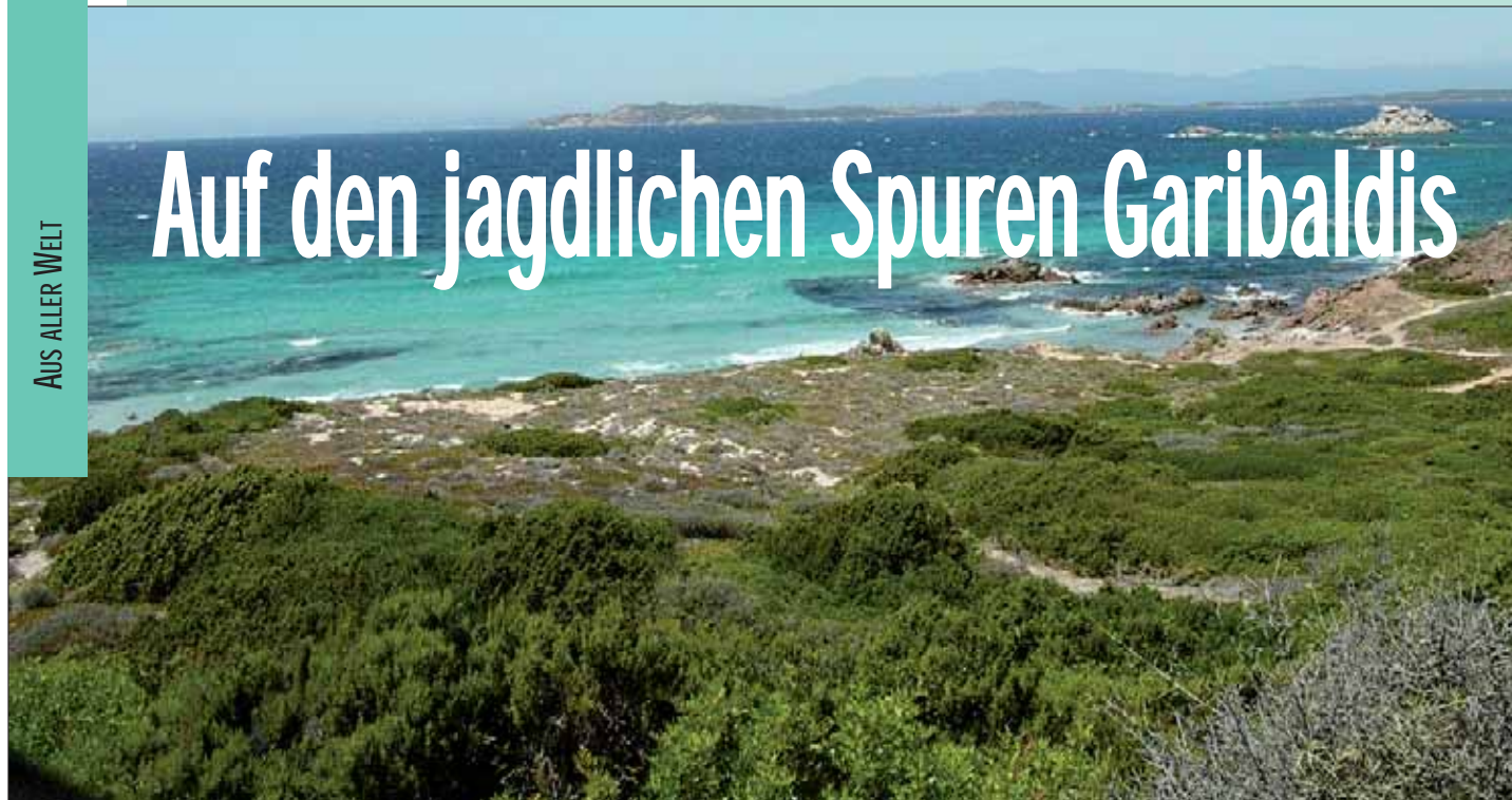
Blick von Sardinien auf Korsika

F rüher war die Gallura, so heißt die sardische Provinz in der wir jagen, sehr dünn besiedelt.