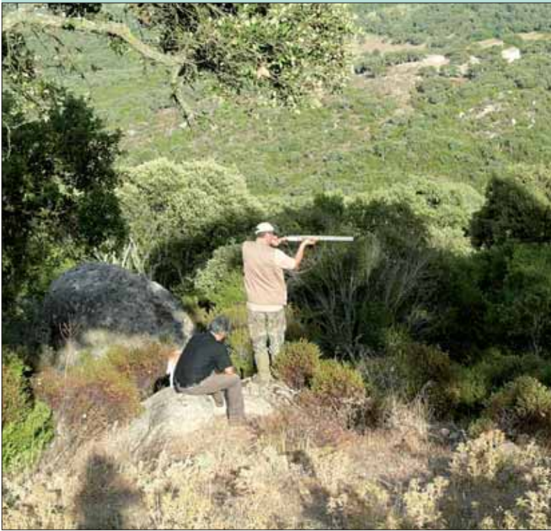
Stand bei den Korkeichen