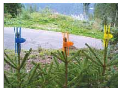
Wir liefern frei Haus von Österreich!